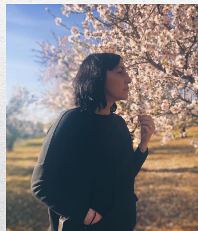
EVA VOCAL REDES SOCIALES